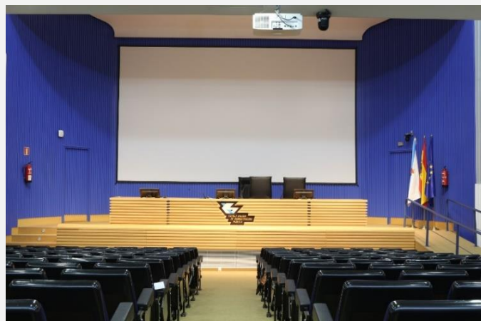
Auditorio con capacidad para 300 personas